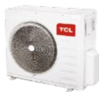
TASM20-18N1A 5,20 кВт