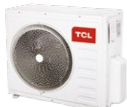
TASM30-21N1A 6,15 кВт