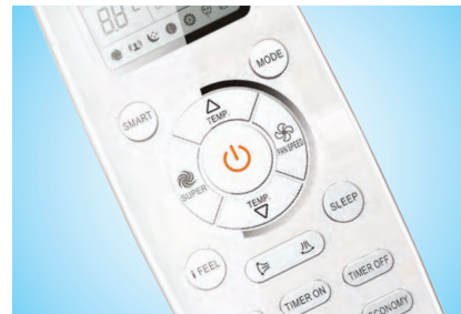
Удобный современный пульт