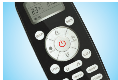
Удобный современный пульт