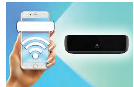
Управление по Wi-Fi