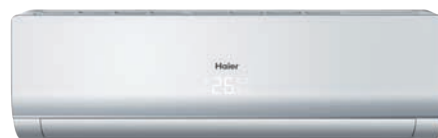
Кондиционер с панелью и корпусом белого цвета