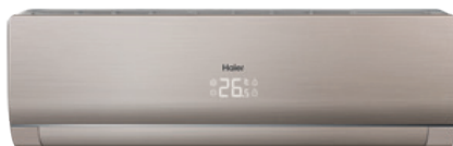
Кондиционер с панелью и корпусом цвета белое золото (кроме модели 24)