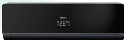
Кондиционер с зеркальной панелью и корпусом темно-графитового цвета