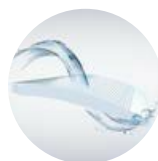
Супер IFD фильтр