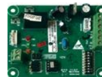
Согласователь работы двух кондиционеров (опция)