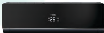
Кондиционер с зеркальной панелью и корпусом темно-графитового цвета