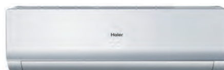
Кондиционер с панелью и корпусом белого цвета