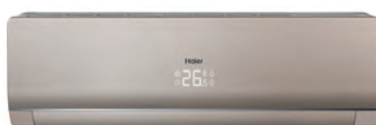
Кондиционер с панелью и корпусом цвета белое золото (Кроме модели 24)