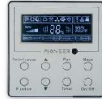
Пульт ДУ Pioneer опционально