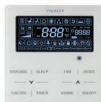
Проводной пульт XK46