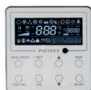
Проводной пульт XK79