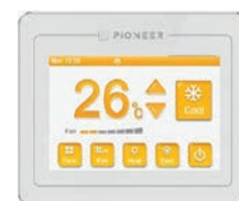
Проводной пульт с цветным дисплеем XK55