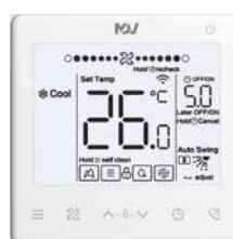
ПДУ WDC3-86S (опция)