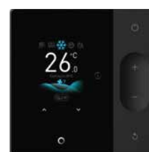
ПДУ WDC3-120T (опция)