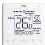
ПДУ WDC3-86S (опция)