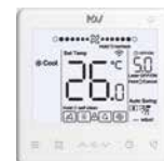
ПДУ WDC3-86S (опция)