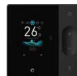
ПДУ WDC3-120T (опция)