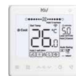
ПДУ WDC3-86S (опция)