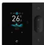
ПДУ WDC3-120T (опция)