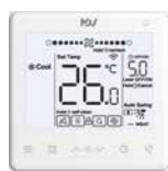
ПДУ WDC3-86S (опция)