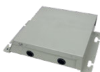
комплект автоматики FCUKZ опция