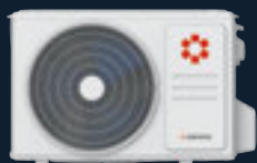
Наружный блок KSRI53HFRN1