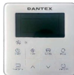
Проводной пульт управления UA-MWR5 (в комплекте)