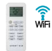
Функциональный пульт ДУ 52T

RK-SAT2/RK-SAT2E — включает устройства с мощностью охлаждения от 2,2 до 7,33 кВт