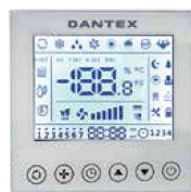
Проводной пульт управления KW-86j2 (опция)

RK-UHT2N/RK-HT2NE-W включает устройства с мощностью охлаждения от 5,175 до 16,12 кВт.