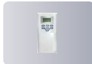
Эргономичный беспроводной пульт ДУ

В воздушно-тепловых завесах Dantex DMN применяется инновационный керамический ПТС нагреватель, в котором предусмотрены две ступени защиты от перегрева. Двигатель повышенной мощности позволяет обеспечить необходимую скорость выхода воздушного потока.