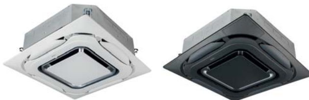
FXFA-A с декоративной панелью BYCQ140EP / FXFA-A с декоративной панелью BYCQ140EPB