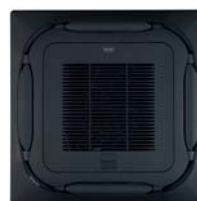
Черная панель с самоочисткой BYCQ140EGFB