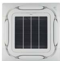
Белая панель / белая панель и серые заслонки BYCQ140E/EW