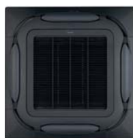
Черная панель BYCQ140EB