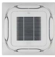
Белая панель с самоочисткой BYCQ140EGF