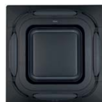
Черная дизайнерская панель BYCQ140EPB