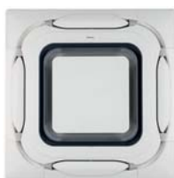
Белая дизайнерская панель BYCQ140EP