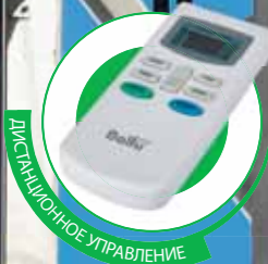
Информативный LED дисплей