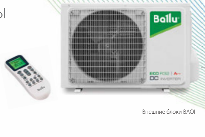
Внешние блоки BA0I