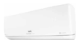
Настенные блоки BSUI-FM Low noise 21 dB(A)