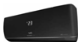
Настенные блоки BSUI-FM_BL Low noise 21 dB(A)