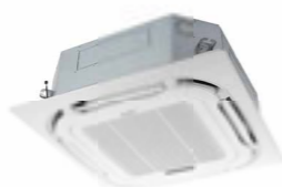
Кассетные блоки BCI-FM Compact