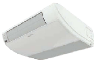
3,5 кВт-5,3 кВт