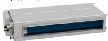
3,5 кВт-8,5 кВт